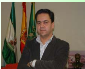
Agustín Pavón Alcalde de Camas