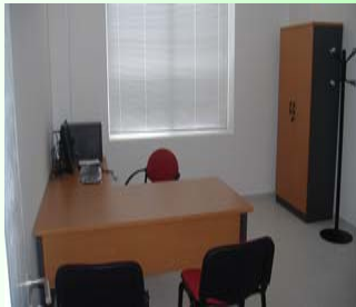
Despacho de Trabajo Social.