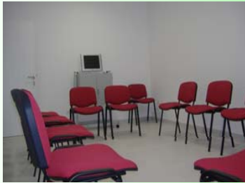
Sala para Terapias Psicológicas